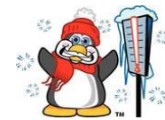
vendredi 5 juillet