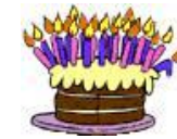
Jeudi 27 juin