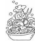
Mardi 2 juillet