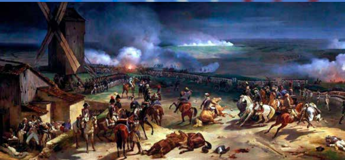
Jean-Baptiste Mauzaisse, Bataille de Valmy, 20 septembre 1792.