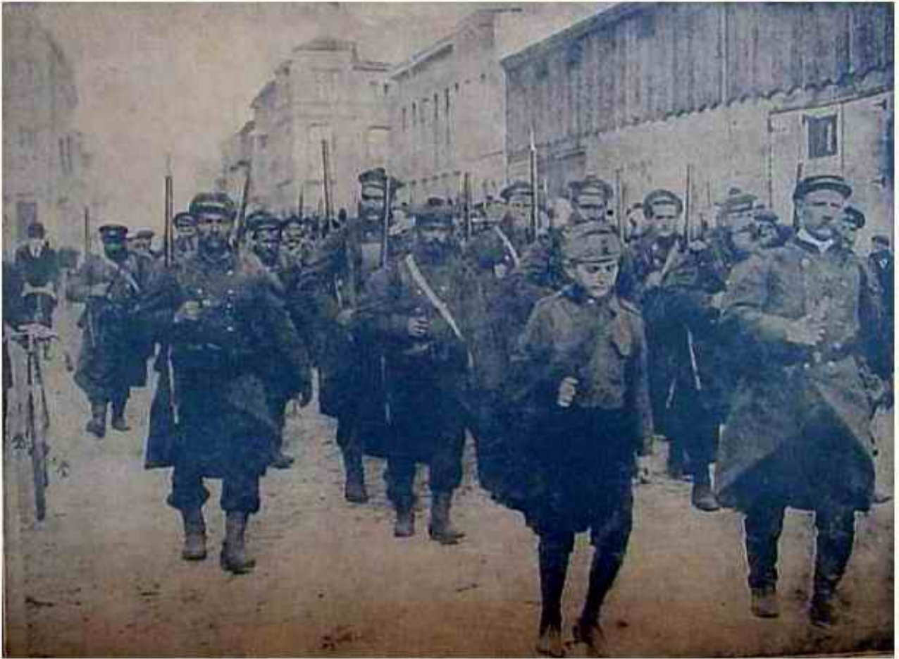
fusillers marins en belgique