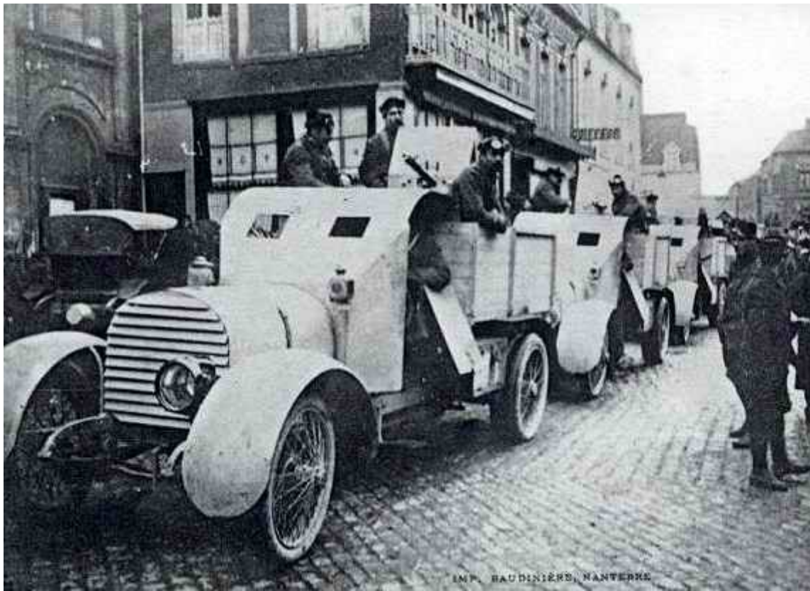
898. La Grande Guerre 1914-15. Dunkerque - Auto-mitrailleuses allant au front des Flandres. Visé Paris 898.