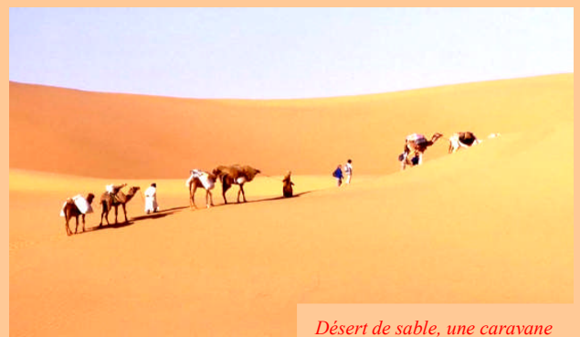
Désert de sable, une caravane