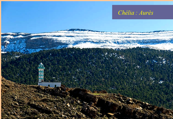
Chélia : Aurès

A l'intérieur, où le climat est continental, l'hiver est particulièrement rude dans les montagnes et sur les hauts plateaux où il neige souvent avec un temps sec et généralement ensoleillé. Le thermomètre descend parfois au-dessous de 0 degré C. Le printemps et l'automne sont agréables avec des températures diurnes de 20 à 25 degrés et des nuits fraîches. Les précipitations sont abondantes et parfois diluviennes pendant ces deux saisons, mais elles sont irrégulières et souvent suivies de longues périodes de sécheresse. Au sud, domaine du Sahara, règne un climat désertique où les étés sont longs, secs et torrides. Au printemps et au début de l'été, le vent sec et chaud du sud, le "Chihili" (Sirocco), souffle jusqu'aux villes du centre du pays. L'hiver sans être aussi froid que dans le nord du pays peut être étonnement glacial la nuit. En revanche, le Sahara est parsemé d'Oasis où s'épanouissent les palmiers dattiers, et abrite des paysages grandioses dans les massifs du Hoggar où les étés sont moins torrides.