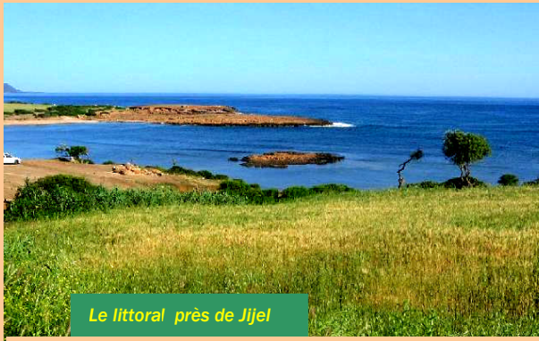
Le littoral près de Jijel

Le littoral algérien bénéficie d'un climat typiquement méditerranéen caractérisé par des hivers doux et des étés chauds, relativement humides sur l'ensemble du littoral. La plus importante pluviométrie explique la concentration des cultures (céréales, agrumes, olivier, vigne...) et de l'élevage (bovin et ovin) dans le nord et sur le littoral qui regroupent la majeure partie de la population. La région du Nord-Est du pays, la plus arrosée, est sans conteste la plus verte et la plus attrayante.