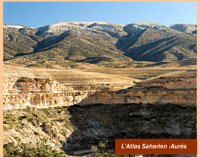
L'Atlas Saharien : Aurès