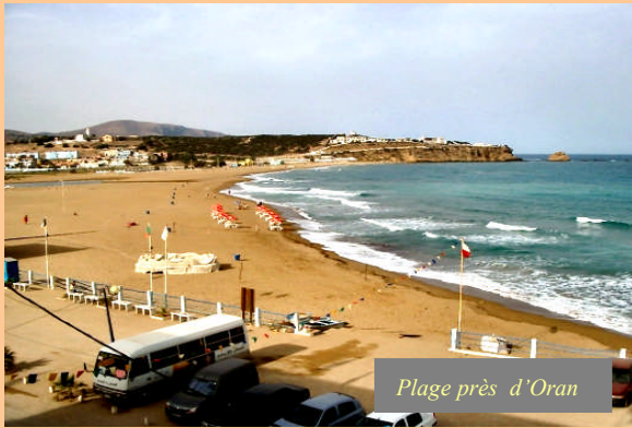
Plage près d'Oran