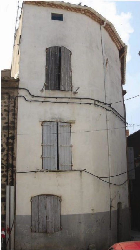
Elévation sur la rue Saint Vénuste Exemple de plan type