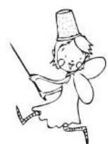
La Fée Cousette