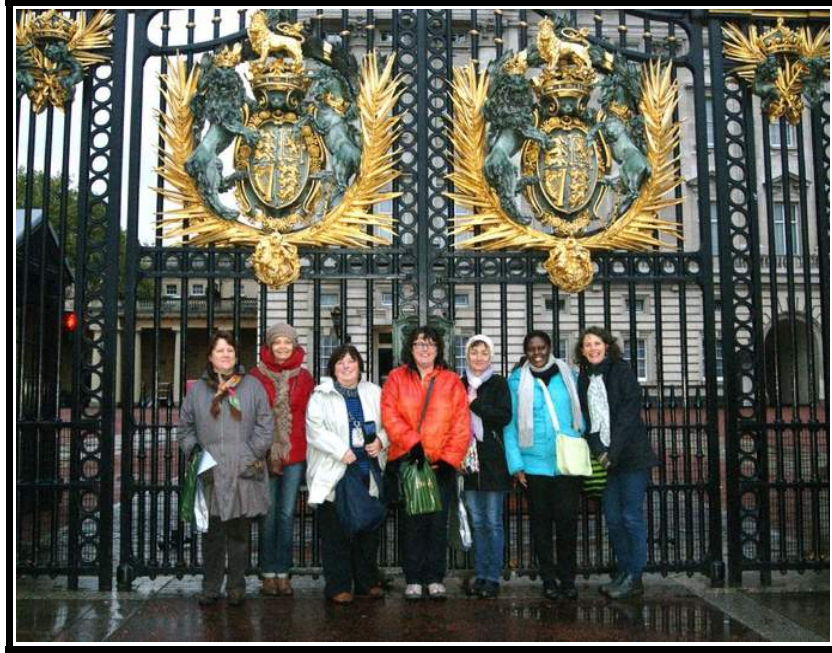
Le club devant Buckingham Palace

Depuis 2013, des cours d'anglais sont assurés par Mme Susan Neill tous les jeudis soir à la mairie de Fontanières.