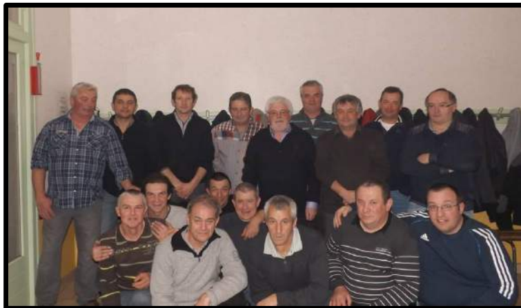
Les anciens joueurs de l'A.S Reterre – Fontanières

L'A.S RETERRE-FONTANIERES a démarré la saison 2014-2015 par le renouvellement du bureau dans son intégralité ,l'ancienne équipe désirant prendre une retraite bien mérité, était en place depuis 35 ans pour certains d'entre eux. Nous les remercions pour le soutien qu'ils nous apportent au quotidien.