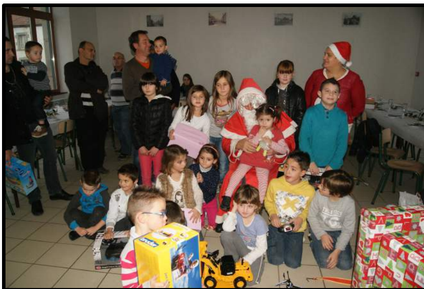
Noël des enfants Décembre 2014

C'est autour d'une équipe motivée que le comité des fêtes a organisé ses festivités habituelles (concours de pêche, fête de la Pentecôte, bal en plein air, soirée moules-frites et choucroute...) et en association avec le club de « l'arbre du château », une sortie au cabaret « Royal Avenue » organisée principalement pour les habitants de Fontanières.