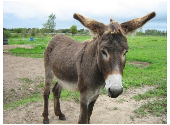
âne - âne