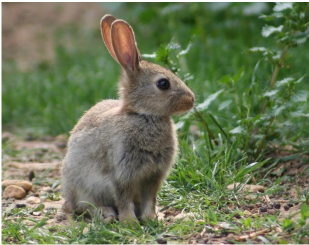
lapin - lapin