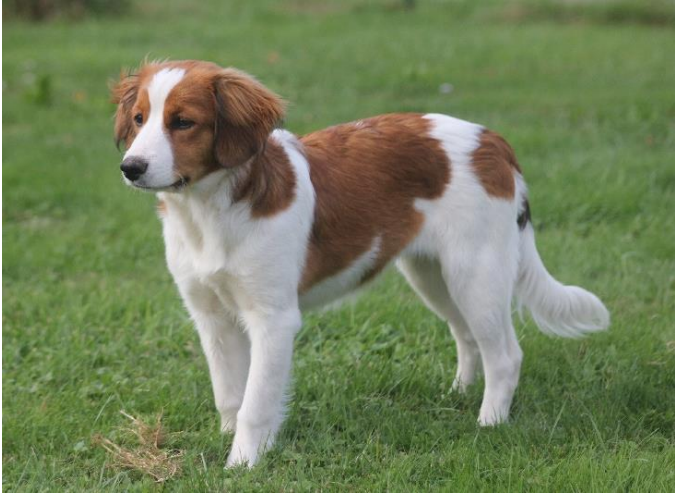
chien - chien