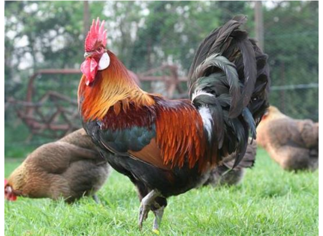
coq - coq