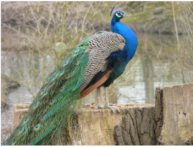
paon - paon