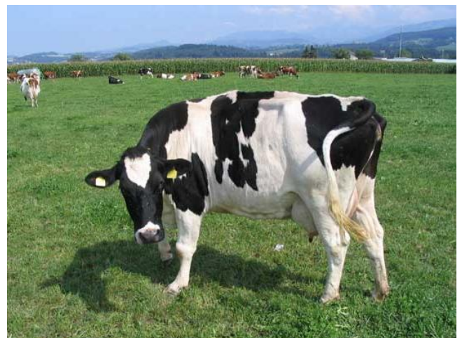
vache - vache