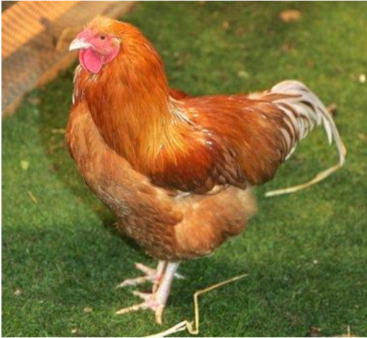
poule - poule