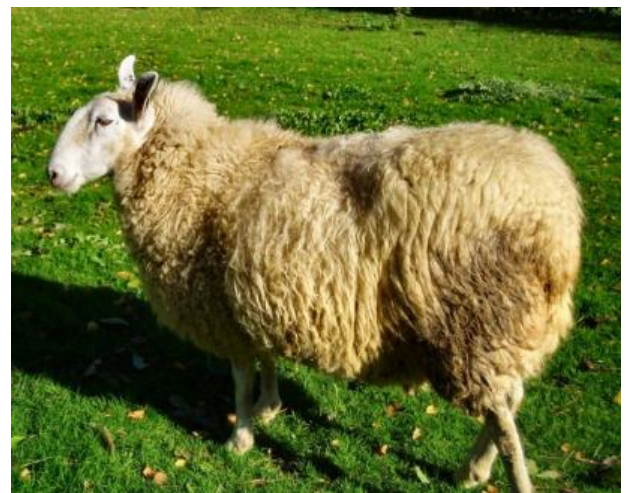
mouton - mouton