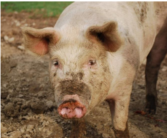
cochon - cochon