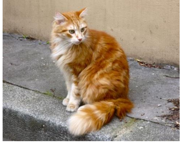
chat - chat