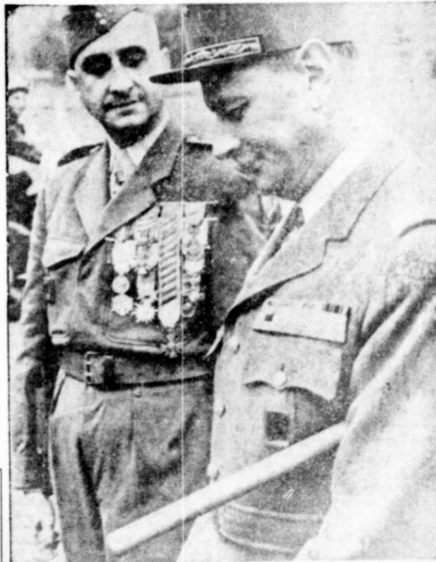
Le général Rethore photographié à Landau (Palatinat) en compagnie du général de Castries qui prend le commandement des troupes françaises en Allemagne. (U.P.)

L'arrivée de ce dernier a commencé le 11 avril 1956.