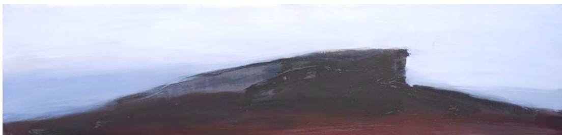
Rodolphe LE CORRE " Monts d'Arrée n°1 ", huile sur toile.