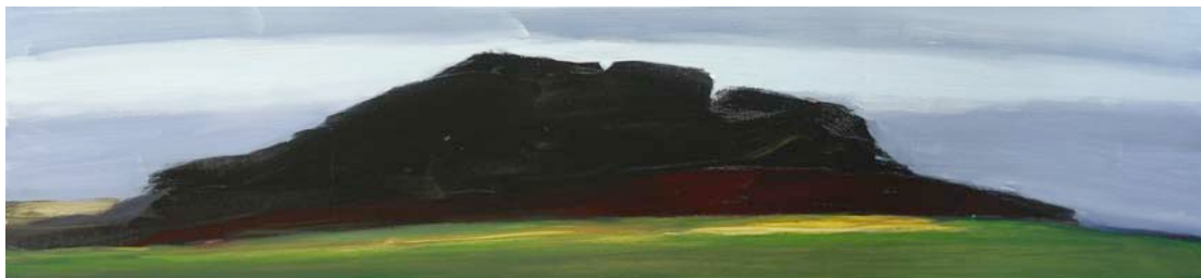
Rodolphe LE CORRE " Monts d'Arrée n° 4 ", huile sur toile.