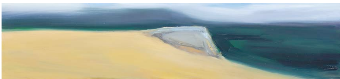
Rodolphe LE CORRE, huile sur toile.