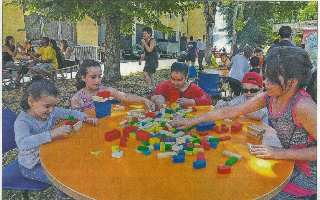
Il n'y a rien de mieux que de faire des bonnes vieilles tours en bois, à l'ombre des arbres.