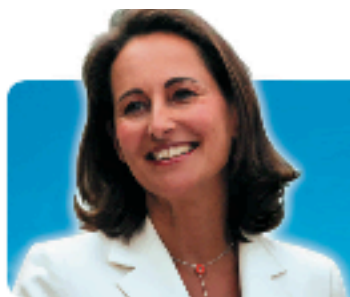
Ségolène Royal candidate à l'élection présidentielle