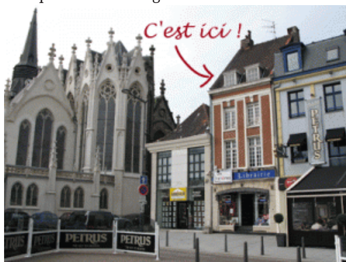
Librairie Les Lisières, Roubaix

livres reçus lors de swap ou juste sans raison par des amis blogueurs.