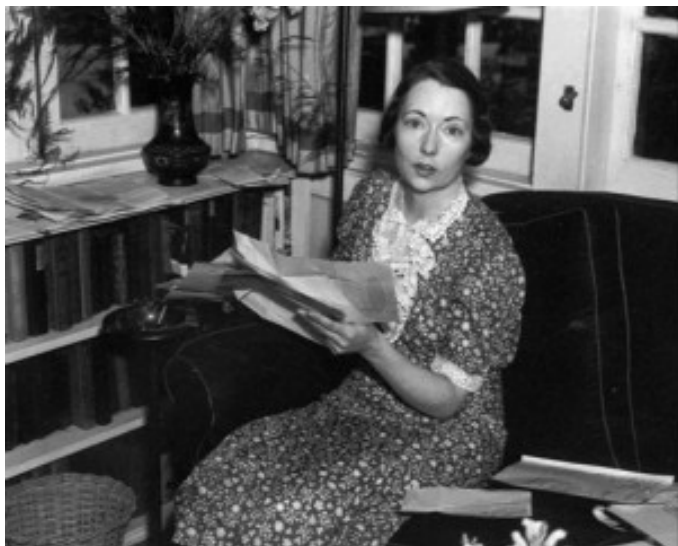
Margaret Mitchell (AP Photo)

pour s'adapter à l'histoire. Parce que son imagination est impressionnante et que son style est superbe (son théâtre, peu connu est à lire aussi).