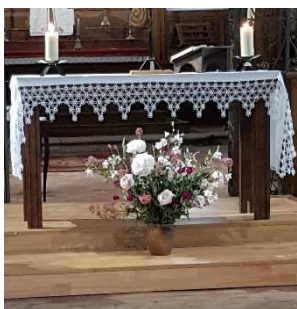
Plessis-Grohan le 20/06/2021

Un grand merci à toutes celles et tous ceux qui nettoient et fleurissent nos églises, préparent et animent les célébrations.