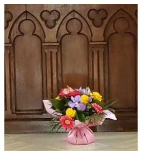
St Aubin le 11/07/2021

Un grand merci à toutes celles et tous ceux qui nettoient et fleurissent nos églises, préparent et animent les célébrations.