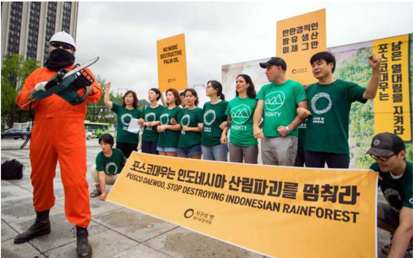
Des activistes sud-coréens manifestent contre la destruction de la forêt tropicale par le conglomérat coréen Posco Daewoo.

indonésienne, comme le constatait un rapport datant de 2013. 7 Selon TANY, une organisation malgache de défenseurs des terres, le fait que la Corée du Sud ait installé une ambassade à Madagascar en juillet 2017 confirme l'intention du gouvernement de relancer le projet. Le rapport de 2013 soulignait également la force des liens qui unissent le groupe Daewoo et le gouvernement sud-coréen. C'est pourquoi le collectif TANY a écrit une lettre ouverte à l'Ambassadeur de Corée à Madagascar, Kim Kwon-il, en janvier 2018 8 , demandant ce qu'il en était du projet agricole de 2008 et ce qui a été promis en échange des nombreux « cadeaux » et investissements sud-coréens concernant d'autres projets à Madagascar, dans le secteur des mines, de l'agriculture, de la pêche ou de l'énergie renouvelable.