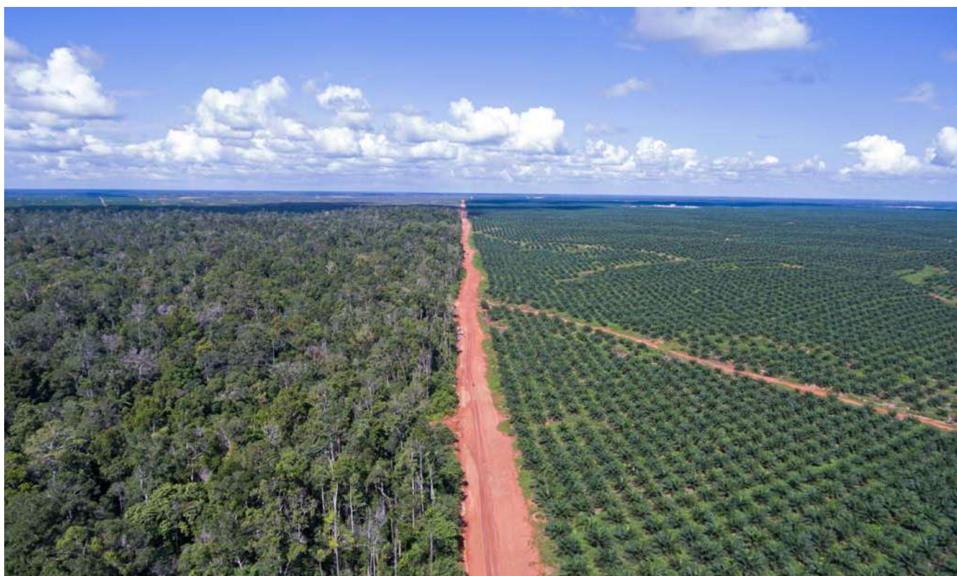
Limite entre la plantation de palmiers à huile PT.BIA de Posco Daewoo et la forêt existante en Papouasie (Indonésie).