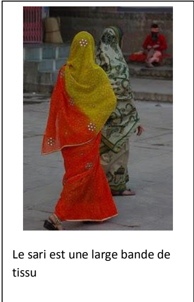
Le sari est une large bande de tissu