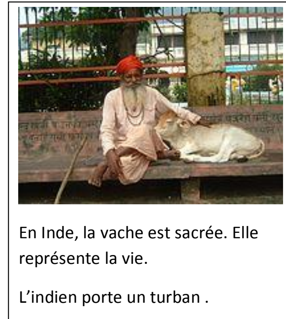
En Inde, la vache est sacrée. Elle représente la vie.