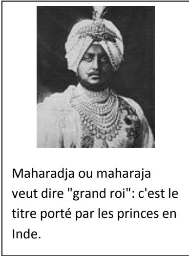
Maharadja ou maharaja veut dire "grand roi": c'est le titre porté par les princes en Inde.