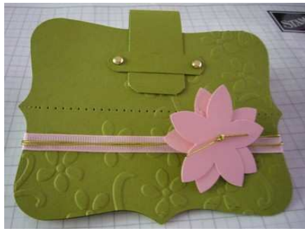
Porte photo de poche