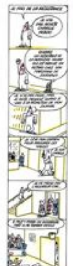
Cartoon: Charlie Hebdo cartoonists