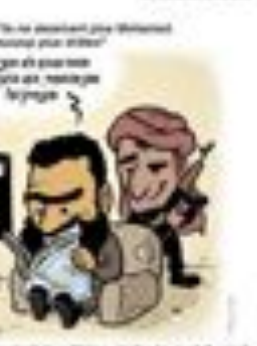
Cartoon: Charlie Hebdo cartoonists