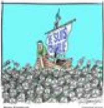
Cartoon: Charlie Hebdo cartoonists