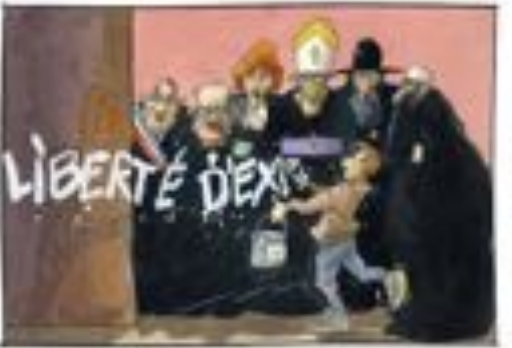
Cartoon: Charlie Hebdo cartoonists