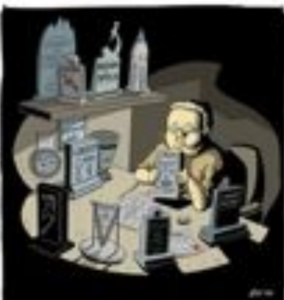
Cartoon: Charlie Hebdo cartoonists