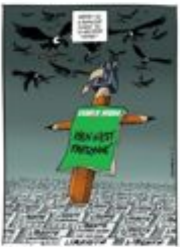
Cartoon: Charlie Hebdo cartoonists