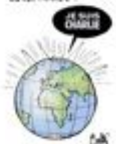
Cartoon: Charlie Hebdo cartoonists