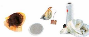
Infusettes, marc de café + filtre, essuie-tout