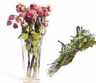
Fleurs fanées, petits déchets verts