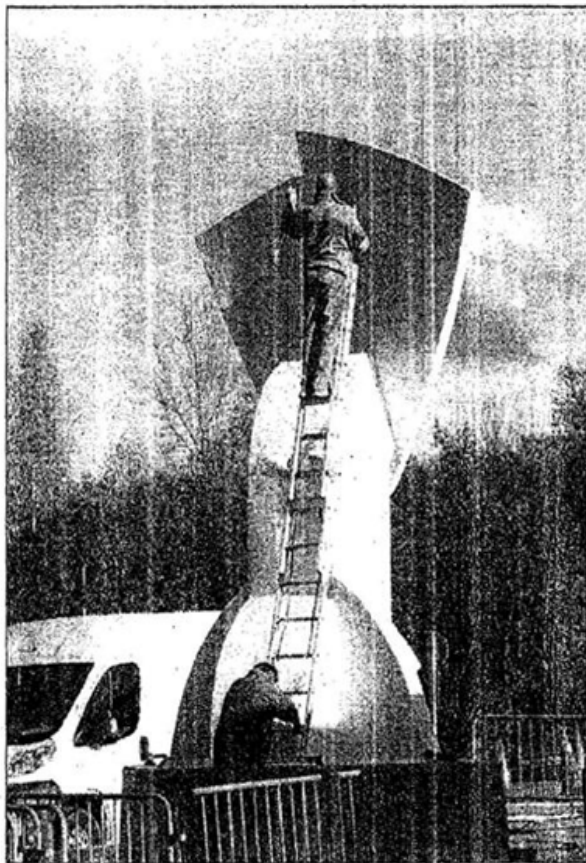
Dernières retouches avant l'inauguration.

Au pied des 5 m de haut de la construction, elle-même fixée sur un socle épais d'un mètre, on peut lire quatre noms. Le plus connu pour avoir fait l'objet d'un hommage national aux Invalides, est celui de Lazare Ponticelli, dernier poilu à s'éteindre à l'âge de 110 ans le 12 mars dernier. Son nom est immortalisé au côté de celui d'Erich Kästner, le dernier Allemand à avoir participé à la guerre 14-18 qui s'est éteint le 1 er janvier 2008 à l'âge de 108 ans. La représentation symbolique