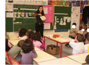
J'écoute une histoire.