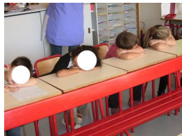
Retour au calme