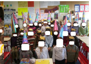
L'heure des parents.