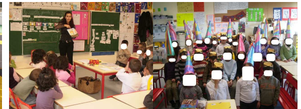
J'écoute une histoire.