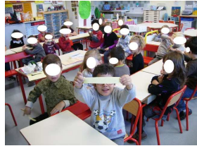
J'écris la date.