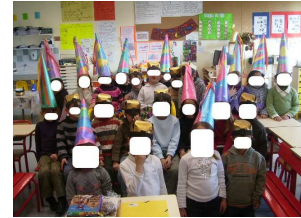
L'heure des parents.