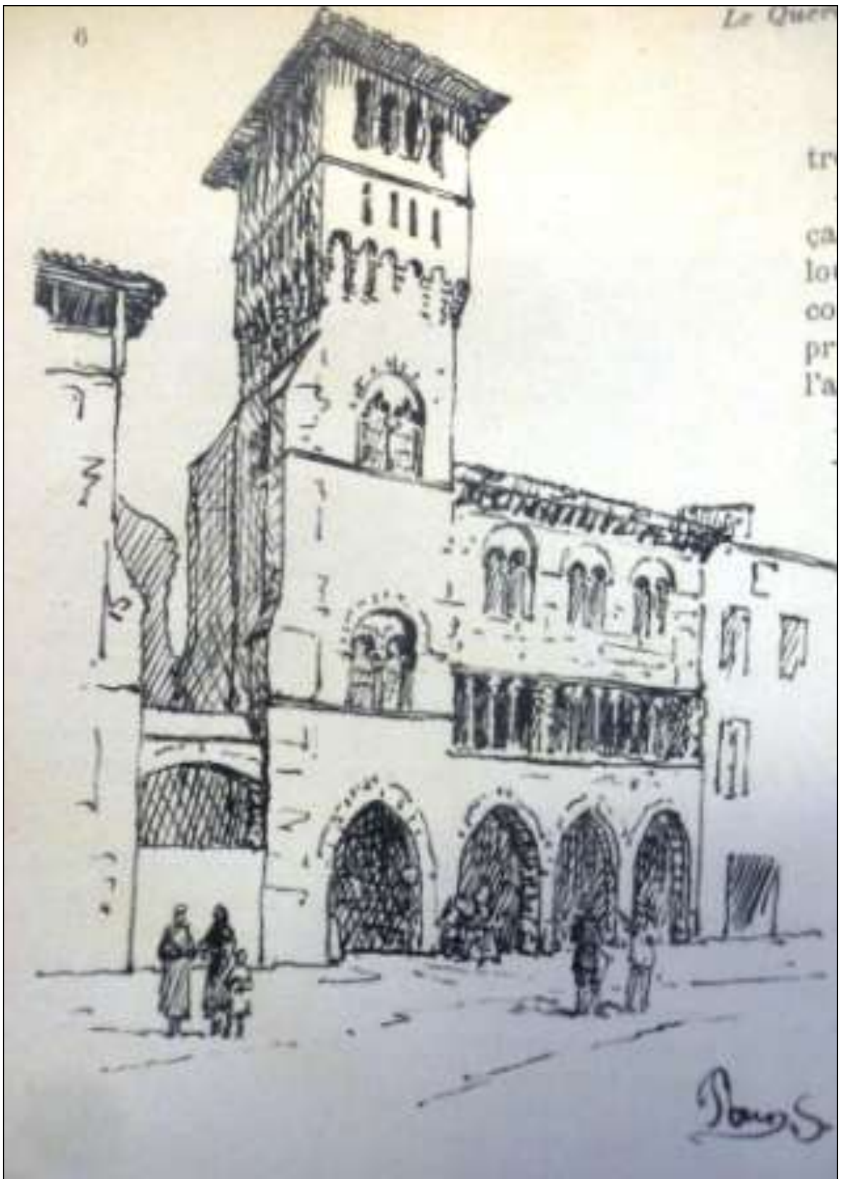
Saint-Antonin ne pouvait qu'être à l'honneur.