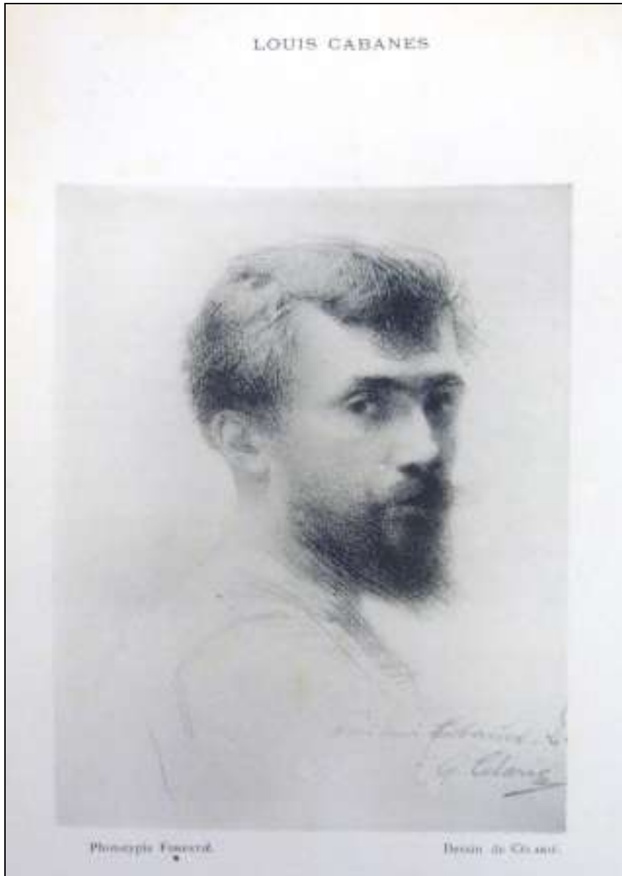
Lous Cabanes dessiné par Célarié