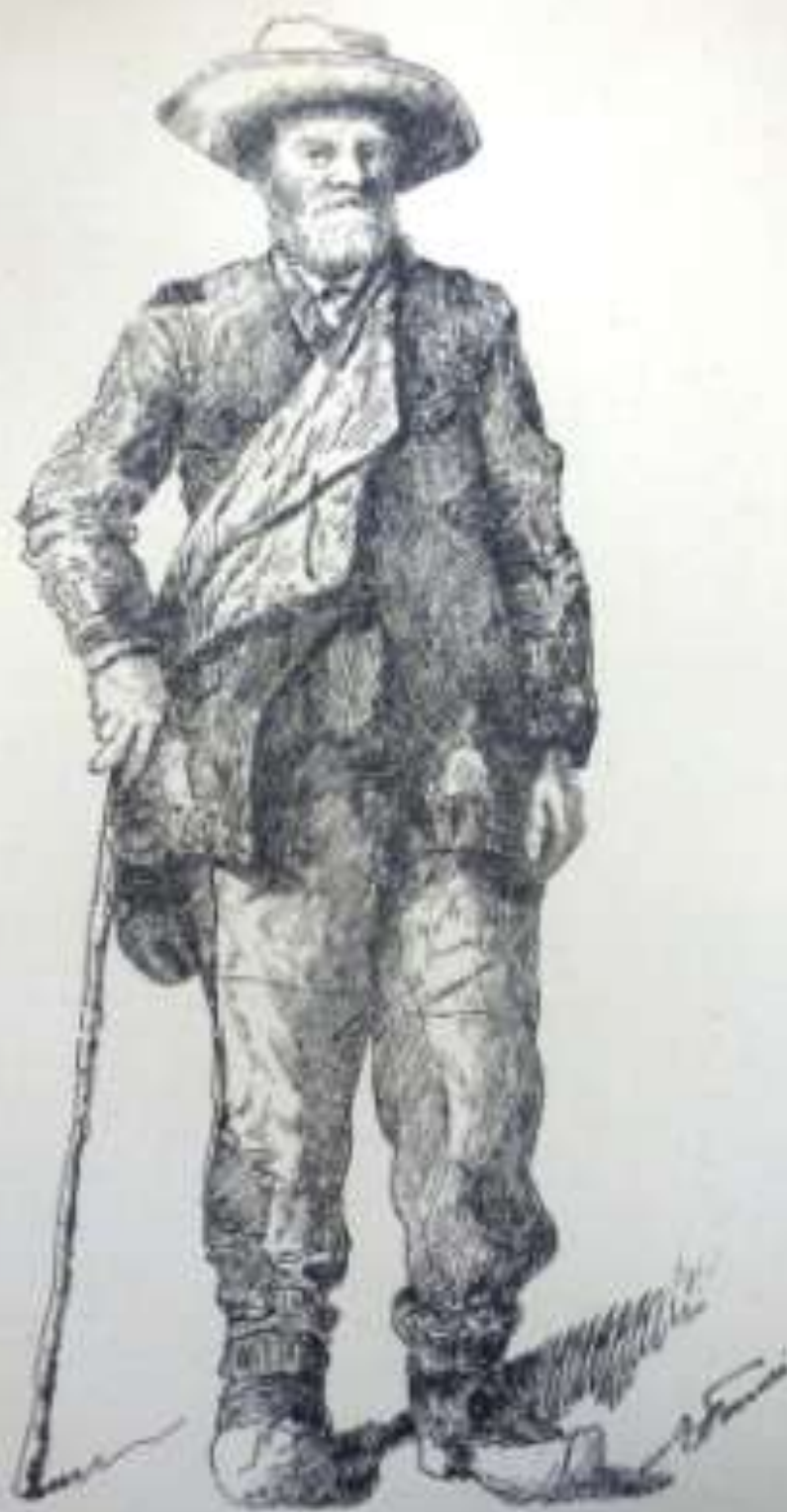
LE CHEMINEAU par FORTÉ