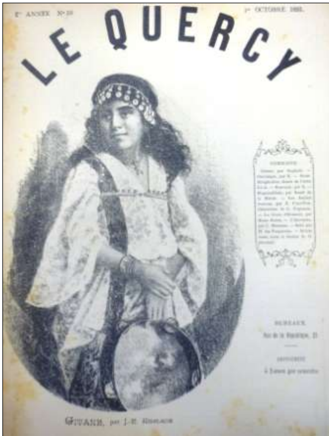
On sort des paysages champêtres avec cette gitane de J-P Anglade.