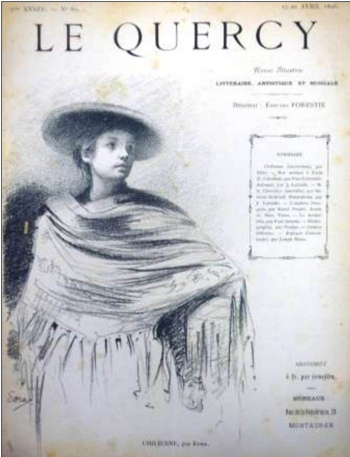
On sort de la vie locale avec La Chilienne d'Edra