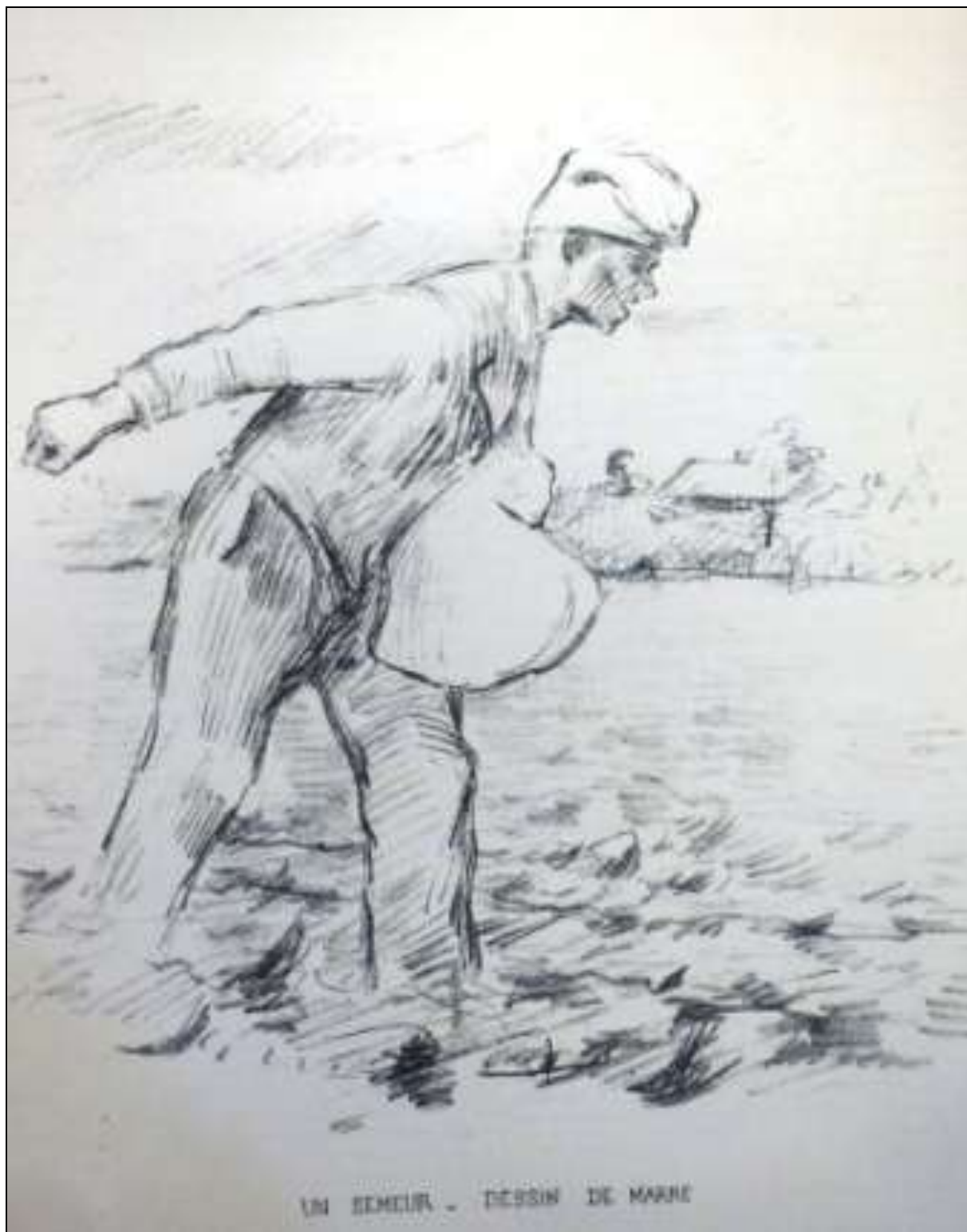
UN SEMEUR - DESSIN DE MARIE