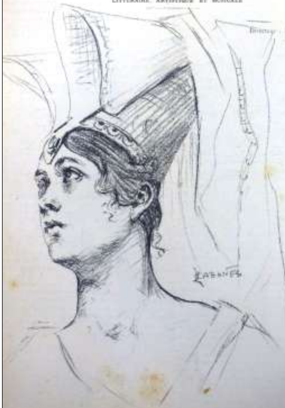
Illustration: ÉTIENNE FORESTIÉ.