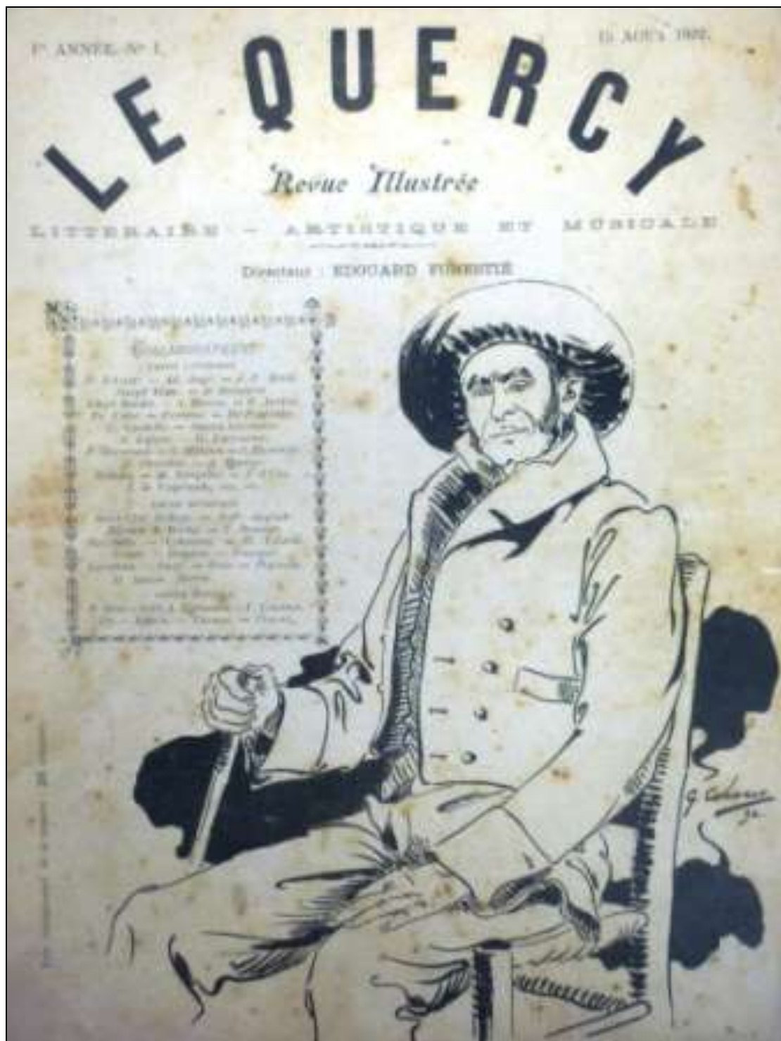
Un paysan vu par Célarié Né en Californie (ses parents avaient été chercheurs d'or) et mort à Montauban le 24 septembre 1931 à 77 ans.