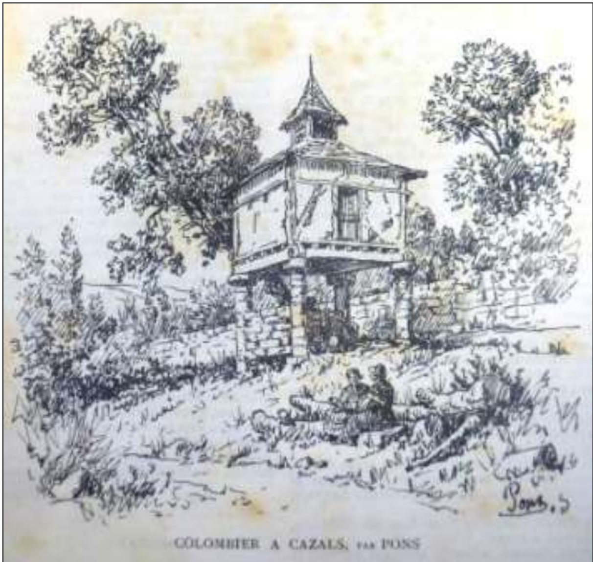
COLOMBIER A CAZALS, PAR PONS