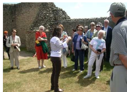
Une forteresse énigmatique