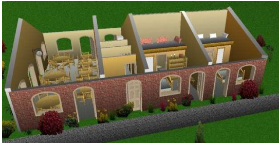
Avant projet de la maison d'hôtes