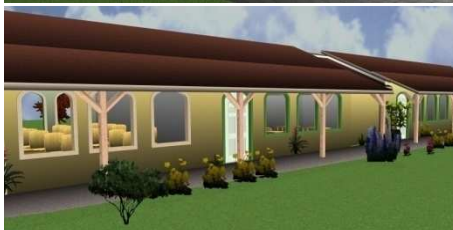
Avant projet de l'école, côté rue et côté cour

A la demande de la commune d'Ambohidratrimo, des associations de parents d'élèves et des enseignants, nous travaillons sur le projet de construction d'une école primaire publique d'une capacité d'accueil de 400 enfants. Un comité de pilotage a été constitué pour réfléchir et impliquer les acteurs locaux dans l'élaboration de ce projet.