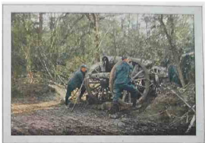
Les canons sont dissimulés de la vue des avions dans la forêt.