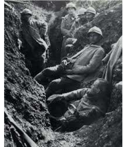
Dans les tranchées

Sur la Voie Sacrée* passent 3900 camions par jour afin de ravitailler les soldats.