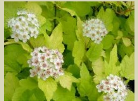
Physocarpus à feuilles d'Obier 'Dart's Gold'

♦ Celui-ci possède également de magnifiques inflorescences roses qui ne passent pas inaperçues dans le jardin !