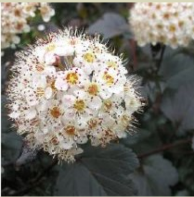
Physocarpus à feuilles d'Obier 'Diabolo' Physocarpus opulifolius