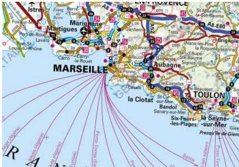
Doc C échelle 1/1.000.000 1 cm sur la carte = 1.000.000 cm sur le terrain.