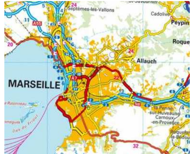
Doc B échelle 1/256.000 1 cm sur la carte = 256000 cm sur le terrain