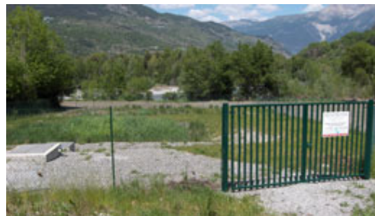
Station par filtres plantés de roseaux à St-Clément

la communauté de communes choisit de construire des stations autonomes par filtre plantés de roseaux (2 à Saint-Clément sur Durance et une à Réotier).