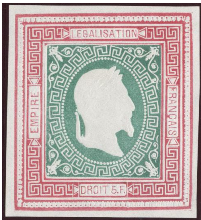
Rose et vert