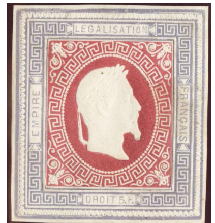
Lilas et rose