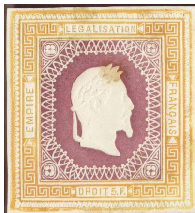
Orange et violet