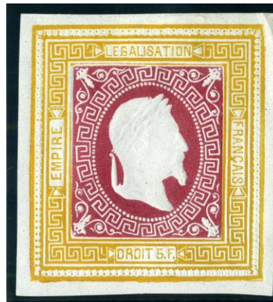
Jaune et carmin