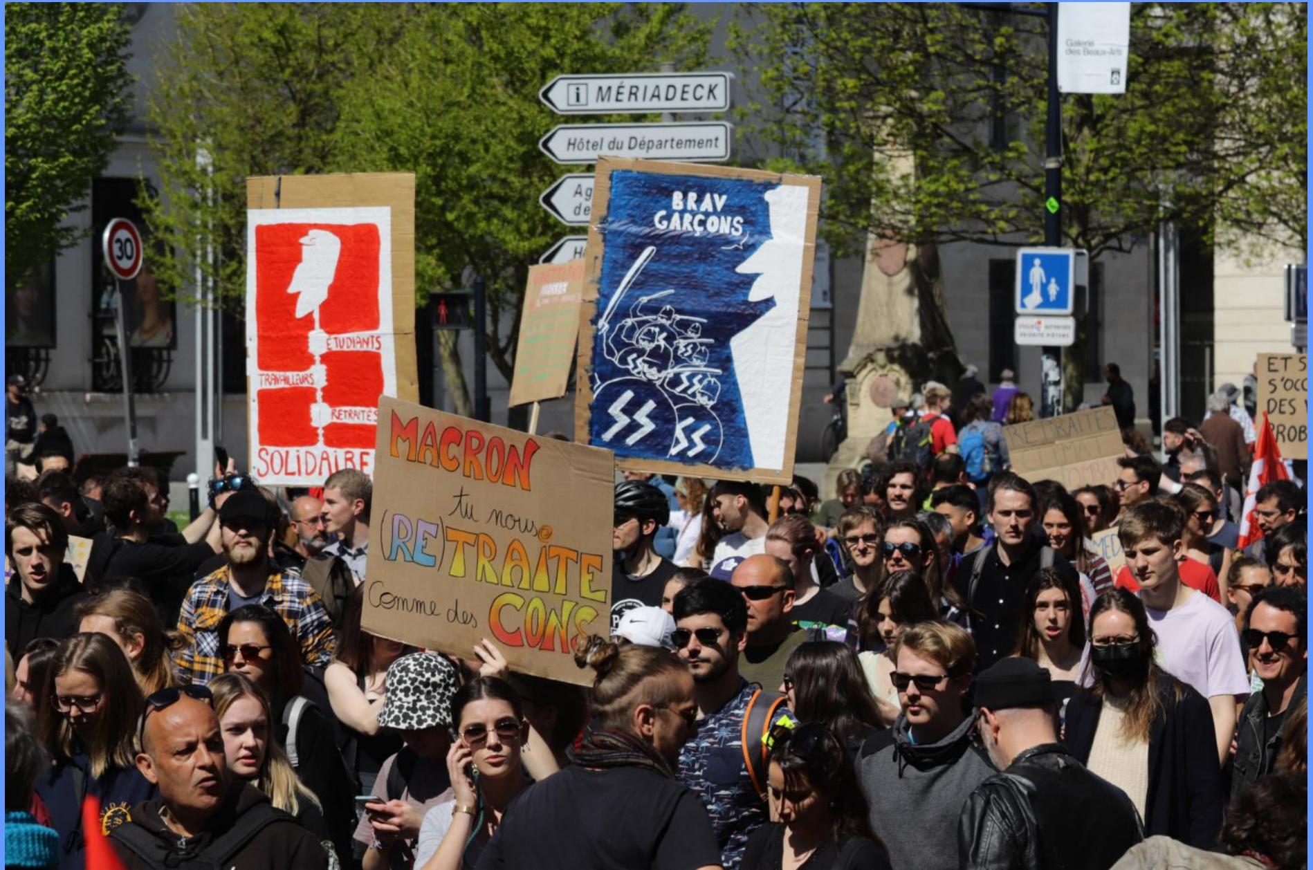
Bordeaux le 6 mars 2023