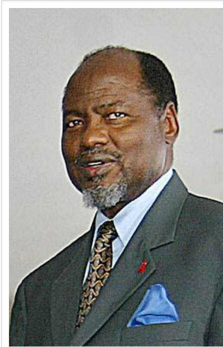
Joaquim Alberto Chissano.

Sa victoire en 1999 sur le candidat de la ReNaMo Alfonso Dhlakama est le théâtre de contestations sur la validité du scrutin et des menaces à un retour à la guerre civile. Ces contestations ont fait l'objet de rapports concordants des observateurs internationaux, hormis l'Organisation de l'unité africaine. Les nombreux cas de corruption à tous les niveaux de l'État au cours de son mandat ont provoqué l'ire des instances internationales. De juillet 2003 à juillet 2004, Chissano était président de l'Union africaine.