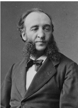
b) Jules Ferry.

b) En 1881 Jules Ferry devient ministre de l'instruction publique, il jugeait nécessaire que des citoyens qui avaient le droit de vote sachent lire, écrire et compter. Il décida donc de nouvelles réformes et commença par rendre l'enseignement primaire gratuit pour tous. L'année suivante il ordonna que l'école devienne obligatoire pour les enfants de 6 à 13 ans. En même temps il fit établir que l'école serait laïque et menée par des instituteurs et institutrices correctement formés. Pour obéir à ces lois des milliers d'écoles furent construites partout en France.