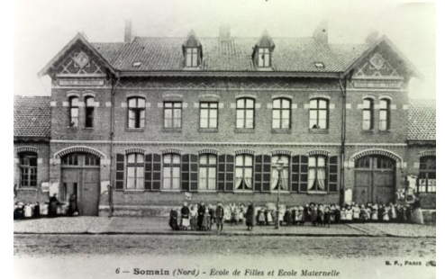
b) Une école somainoise, héritage des lois Ferry (L'actuelle école Marie Curie)

b) En 1881 Jules Ferry devient ministre de l'instruction publique, il jugeait nécessaire que des citoyens qui avaient le droit de vote sachent lire, écrire et compter. Il décida donc de nouvelles réformes et commença par rendre l'enseignement primaire gratuit pour tous. L'année suivante il ordonna que l'école devienne obligatoire pour les enfants de 6 à 13 ans. En même temps il fit établir que l'école serait laïque et menée par des instituteurs et institutrices correctement formés. Pour obéir à ces lois des milliers d'écoles furent construites partout en France.