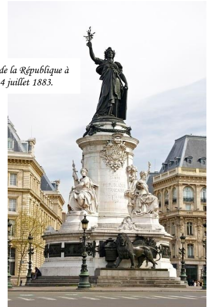
d) Marianne, place de la République à Paris inaugurée le 14 juillet 1883.

c) Attachés aux libertés, les Républicains font voter des lois sur la liberté de la presse, la liberté de réunion et d'association. Elles permettent désormais aux citoyens français de se réunir librement, d'exprimer leur opinion dans la presse et surtout elles offrent aux ouvriers la possibilité de créer des syndicats chargés de les protéger contre les abus des patrons. En 1905, le parlement vote également la loi de séparation des églises et de l'état qui déclare que la France est désormais un état laïc sans religion dominante.