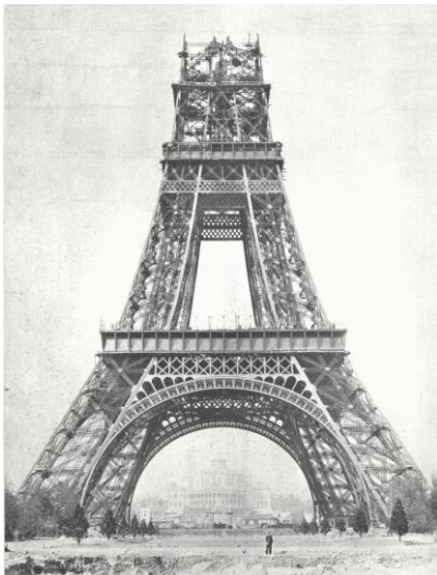
e) La construction de la Tour Eiffel.

d) Alors que le drapeau tricolore avait été adopté depuis 1830, la troisième République revendique son héritage révolutionnaire en rétablissant la Marseillaise comme hymne national. Le 14 juillet, date anniversaire de la prise de la Bastille et de la fête de la fédération est choisi comme fête nationale. Les bustes de Marianne, personnification de la République, sont installés dans les mairies et la devise : liberté, égalité, fraternité est gravée au fronton des bâtiments publics.