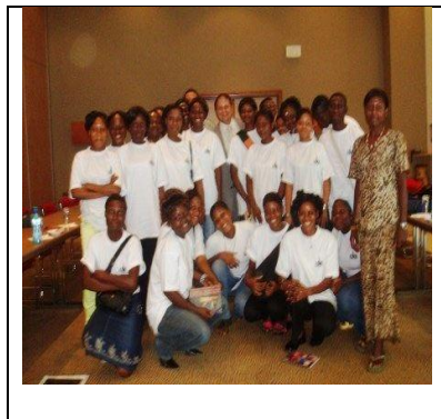
Les élèves de l'IMR

Contactez nous sur : ahsmbenin@gmail.com