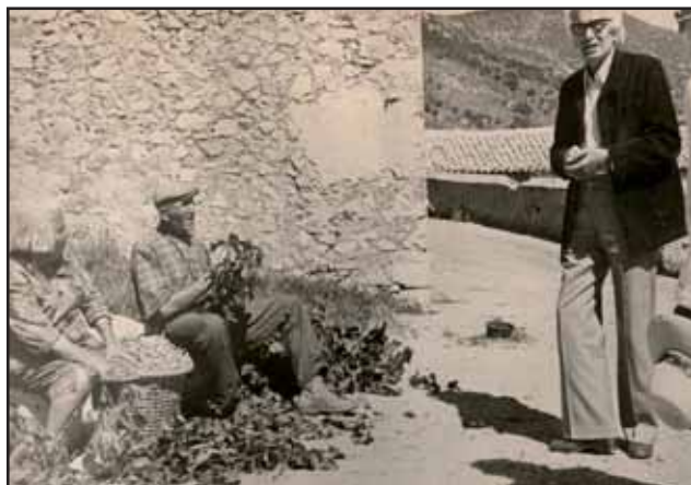
René Barjavel lors du tournage du Téléfilm "Tarendol" en 1979

Nous remonterons pour émerger dans les plus beaux champs d'abricotiers que nous offre le travail tenace des gens de ce pays.