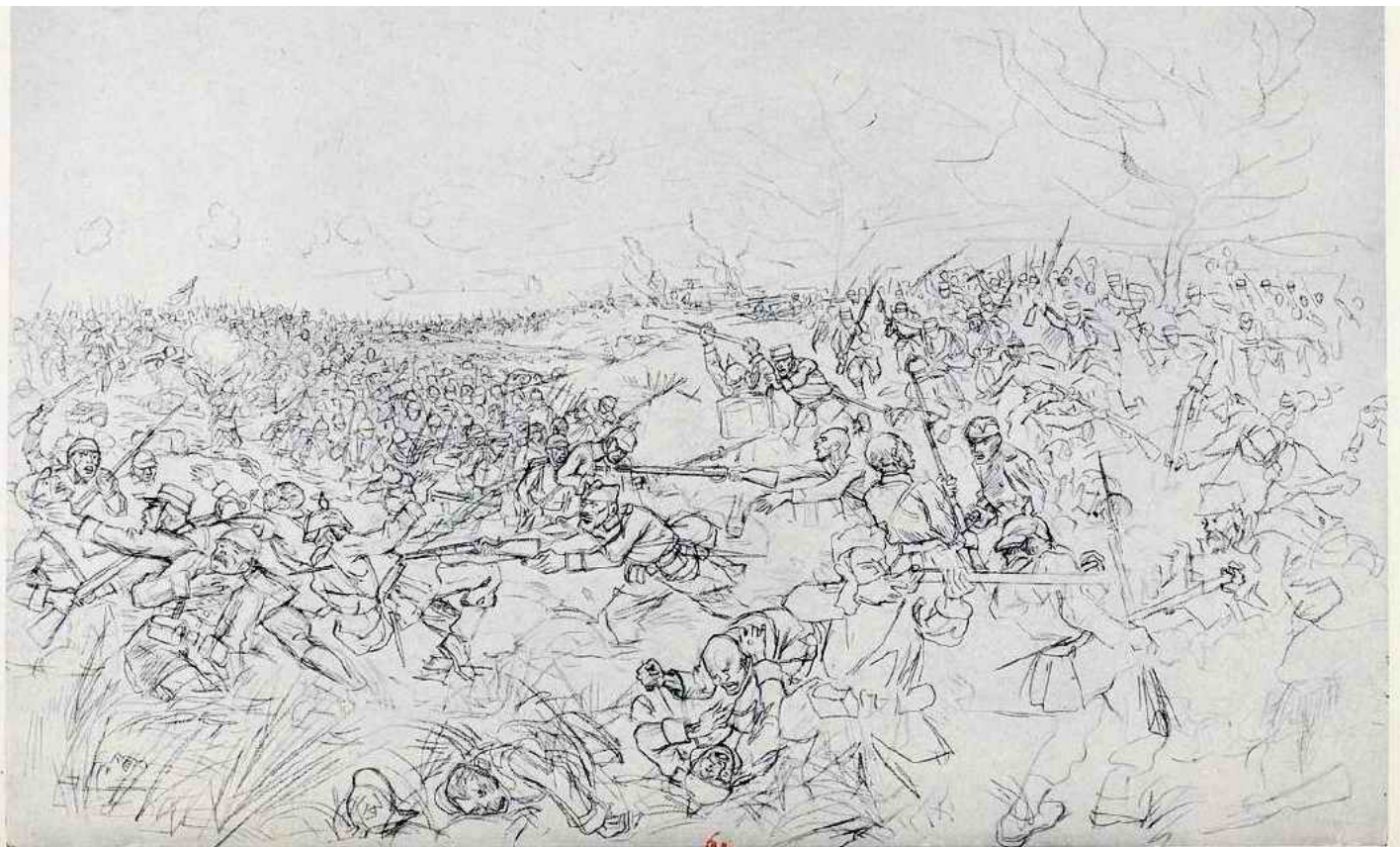
G. JEANNIOT — COMBAT SUR LES BORDS DE L'YSER (CROQUIS ORIGINAL AU CRAYON)