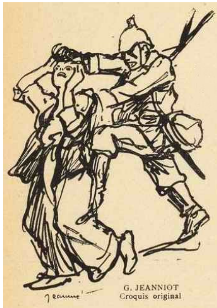
G. JEANNIOT Croquis original