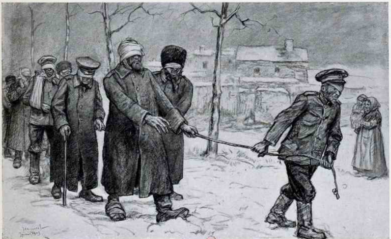
GEORGES JEANNIOT — LES BLESSÉS RUSSES (DESSIN ORIGINAL AU LAVIS)

Des soldats russes avaient eu les yeux brûlés par des jets de vitriol dirigés sur eux, dans les tranchées, par des soldats allemands. Dans cette tragique et douloureuse composition, Jeannot nous montre ces malheureux conduits dans les rues de la ville de Lvoff au moyen d'une corde.