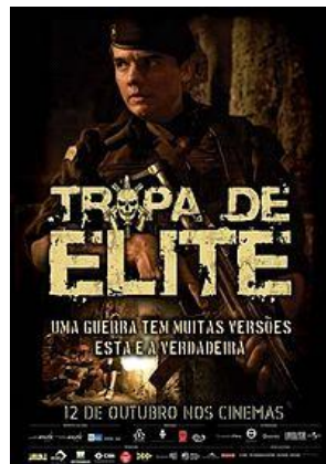
Le titre du film.