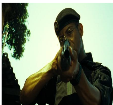
Le moment que le Capitaine du BOPE Nascimento et Matias tuent le trafiquant Baiano.