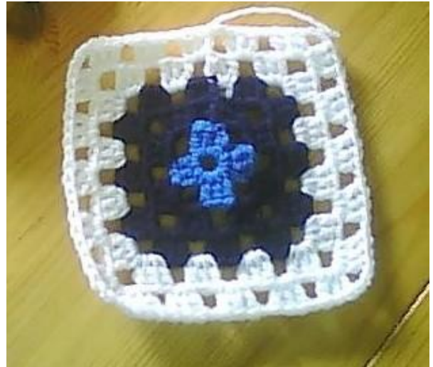
Sac réalisé avec 19 carrés simples