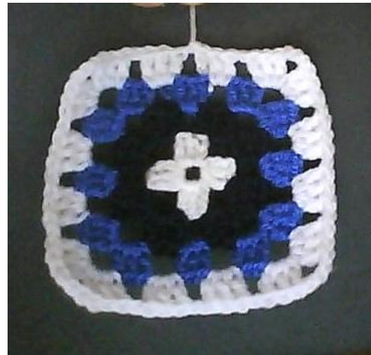
Sac réalisé avec 13 carrés simples