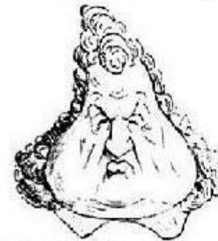
Le roi Louis-Philippe, sous le nom de Louis-Philippe.