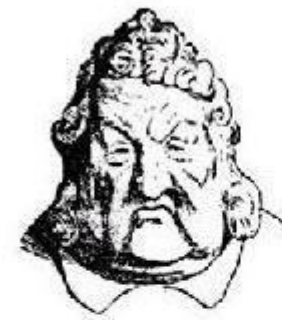
Le roi Louis-Philippe, sous le nom de Louis-Philippe.

Vendues pour payer les 6,000 fr. d'amende du journal le Charivari .