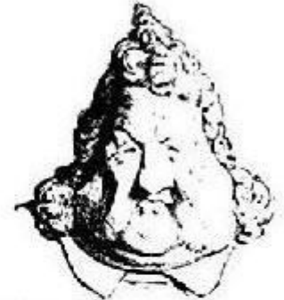
Le roi Louis-Philippe, sous le nom de Louis-Philippe.