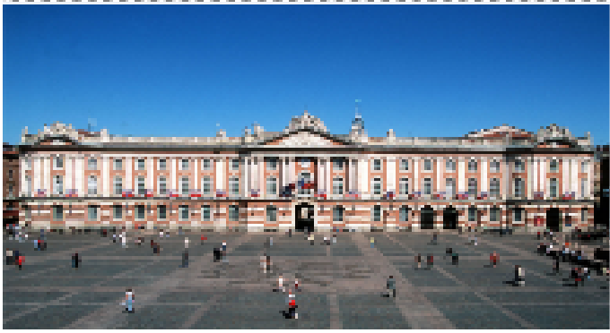
La place du Capitole

5. Indique sous chaque photo le nom de la ville où elle a été prise.