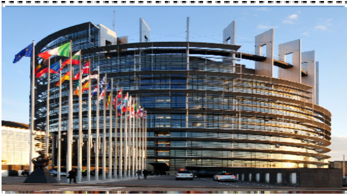
Le siège du parlement européen