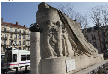
Monument aux morts place Fourneyron

Ce n'est qu'avec l'entrée en guerre des USA (hommes supplémentaires et armes) et le retour de phase de mouvements que la Triple Entente l'emporte. L'armistice sera signée le 11 novembre 1918 .