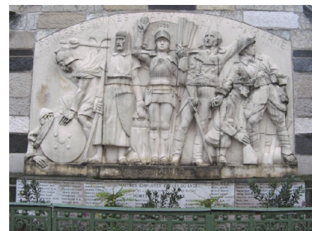
Mur du lycée Fauriel