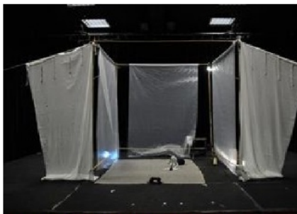
Structure bambou (min 2m sur 2m)

Un spectacle dont la diffusion peut se concevoir en vélo, en transport en commun.