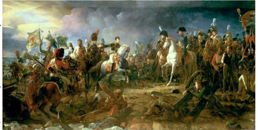
a) La bataille d'Austerlitz, François Gérard.

a) Grâce à d'éclatantes victoires Austerlitz, Iéna, Friedland, Wagram... l'Empire s'est étendu sur une grande partie de l'Europe. Seule l'Angleterre s'oppose victorieusement à Napoléon grâce à sa marine qui détruit la flotte française à Trafalgar. Pour renforcer son pouvoir et montrer à tous que l'empire est héréditaire, Napoléon est sacré empereur en la cathédrale Notre-Dame de Paris le 02 décembre 1804. Le pape Pie VII est présent mais c'est Napoléon qui se couronne lui-même et qui couronne Joséphine sa femme.