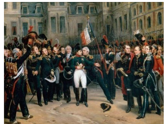
d) Adieux de Napoléon à la Garde impériale dans la cour du Cheval-Blanc du château de Fontainebleau, Antoine Alphonse Montfort.

d) Après la retraite de Russie et de nombreuses défaites le grand Empire n'existe plus et la France est envahie. Les pays ennemis qui s'unissent pour vaincre Napoléon, occupent bientôt Paris et l'envoient de force se retirer sur l'île d'Elbe, une petite île située dans la Méditerranée. 11 mois plus tard Napoléon revient en France. Sa marche vers Paris est triomphale mais la guerre reprend immédiatement et les Français perdent la bataille de Waterloo, en Belgique face aux Anglais. Napoléon vaincu et malade est fait prisonnier et embarqué de force pour Sainte Hélène où il meurt en 1821.