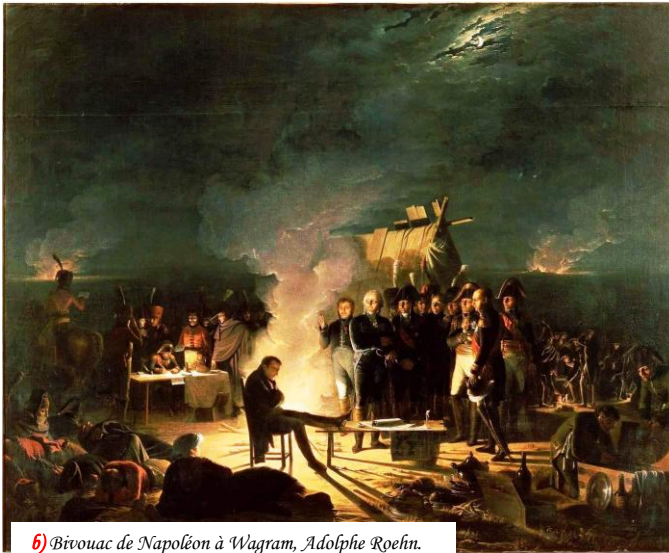
b) Bivouac de Napoléon à Wagram, Adolphe Roehn.

6) Napoléon 1 er était très attaché à son armée surnommée « la grande armée ». Au départ elle n'était composée que de Français mais avec les nombreuses pertes, elle fut progressivement complétée avec des troupes venues de tous les pays de l'Empire. Ses soldats appelés « les grognards » lui étaient fidèles jusqu'à la mort. L'Empereur n'hésitait pas à partager leur vie quotidienne dans un campement. La veille d'un combat, il venait les encourager et il les félicitait après la victoire.