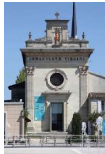
Photo : Façade ouest de la chapelle du Carmel de Libourne

Site internet http://www.ville-libourne.fr