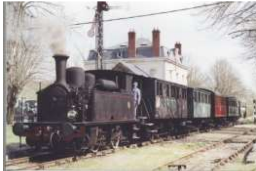
Photo : Le Train à Vapeur en Gare de Guîtres