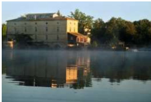
Photo : Le moulin du Barrage, sur l'Isle