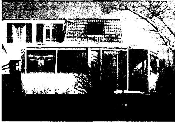
Vue du jardin (façade sud ) avant travaux