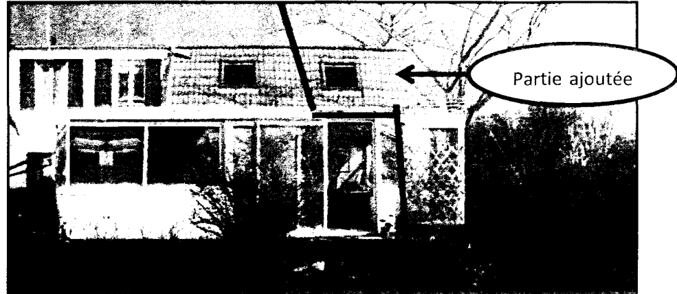
Vue du jardin (façade sud) après travaux