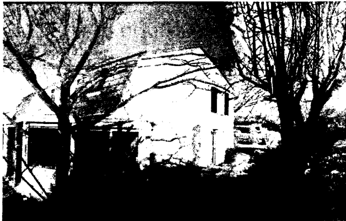
Vue de la route (façade est) avant travaux