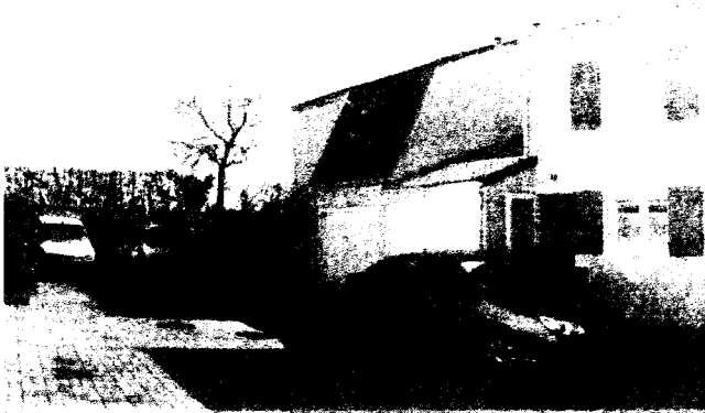
Vue de la placette (façade nord) avant travaux