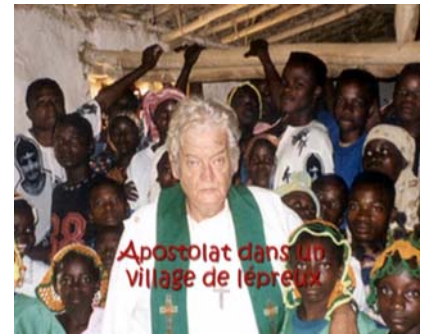
Chez les lépreux