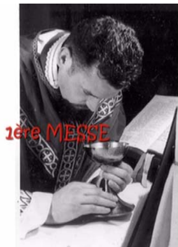
1 ère Messe