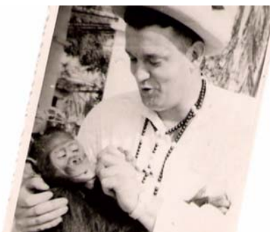
Avec son chimpanzé