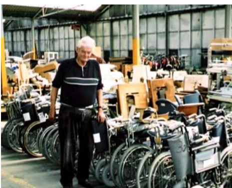
Matériel pour handicapés