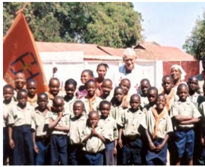
Avec les scouts