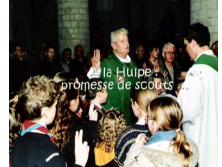
A La Hulpe