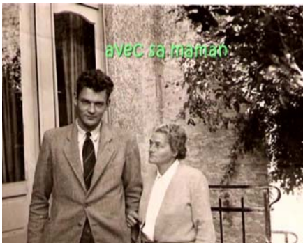
Avec sa maman

Quelques images d'archives extraites du montage audiovisuel réalisé à l'occasion du Jubilé