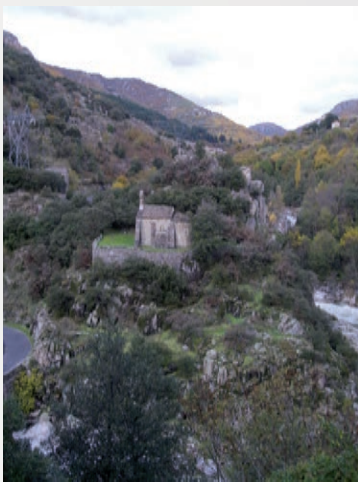
Prieuré de Planchamp - XII e siècle

Frais d'inscription : 15 Euros - Hébergement et repas pris en charge - Semaine de six jours Inscriptions et renseignements : gemarcho@wanadoo.fr