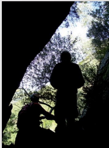
Entrée de mine