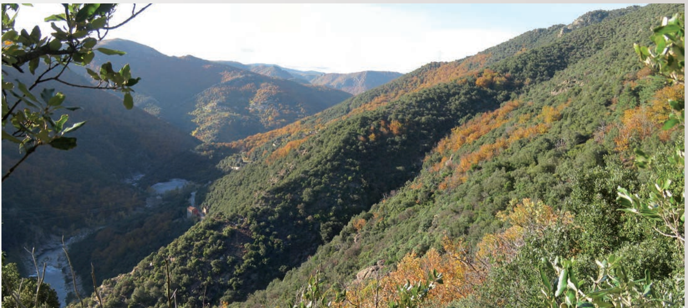
Vue de la colline du Colombier