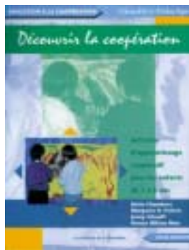
Collection Chenelière/Didactique .Editions Pirouette