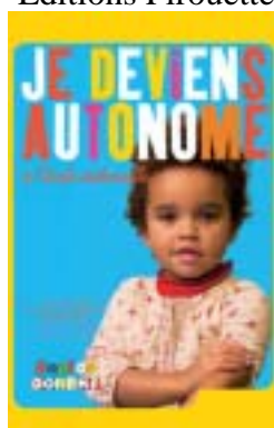
collection Dopido DOREMI, Editions Pirouette