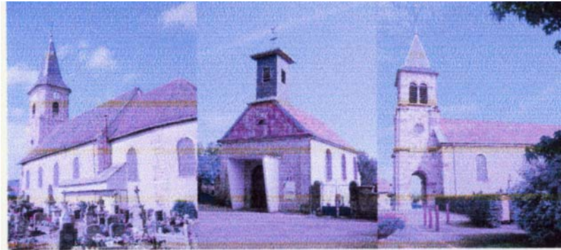
Lachapelle sous Chauv Errevet Evette-Salbert Sermamagny