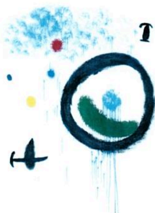
Joan Miró, Naissance du jour II , 1964. Collection Fondation Maeght.