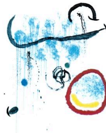
Joan Miró, Naissance du jour III, 1964. Collection Fondation Maeght.