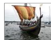
Avec sa grande et unique voile carrée et ses 65 membres d'équipage, le drakkar fait cap sur l'Irlande, où l'original a été construit en 1040 dans la forêt de Glendalough