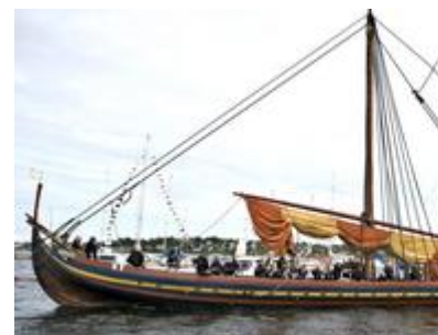
« L'étalon de la mer de Glendalough » est le plus grand drakkar jamais reconstruit. Il a quitté dimanche le port de Roskilde