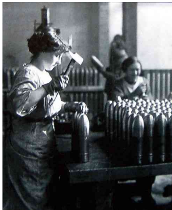
photo prise en 1916, France